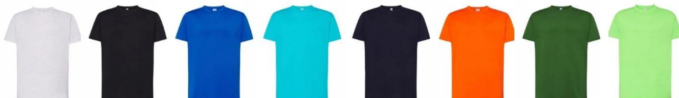
Biała Czarna Chabrowa Turkus Granatowa Pomarańczowa Zielony butelka Limonka