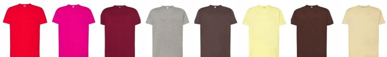
Czerwona Fuksja Burgund Szary melaż Grafit Lemon Czekolada Beż